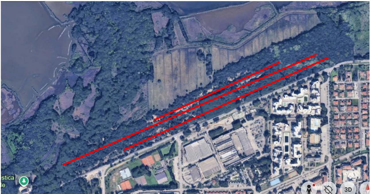
Figura 3 Transetti di monitoraggio.