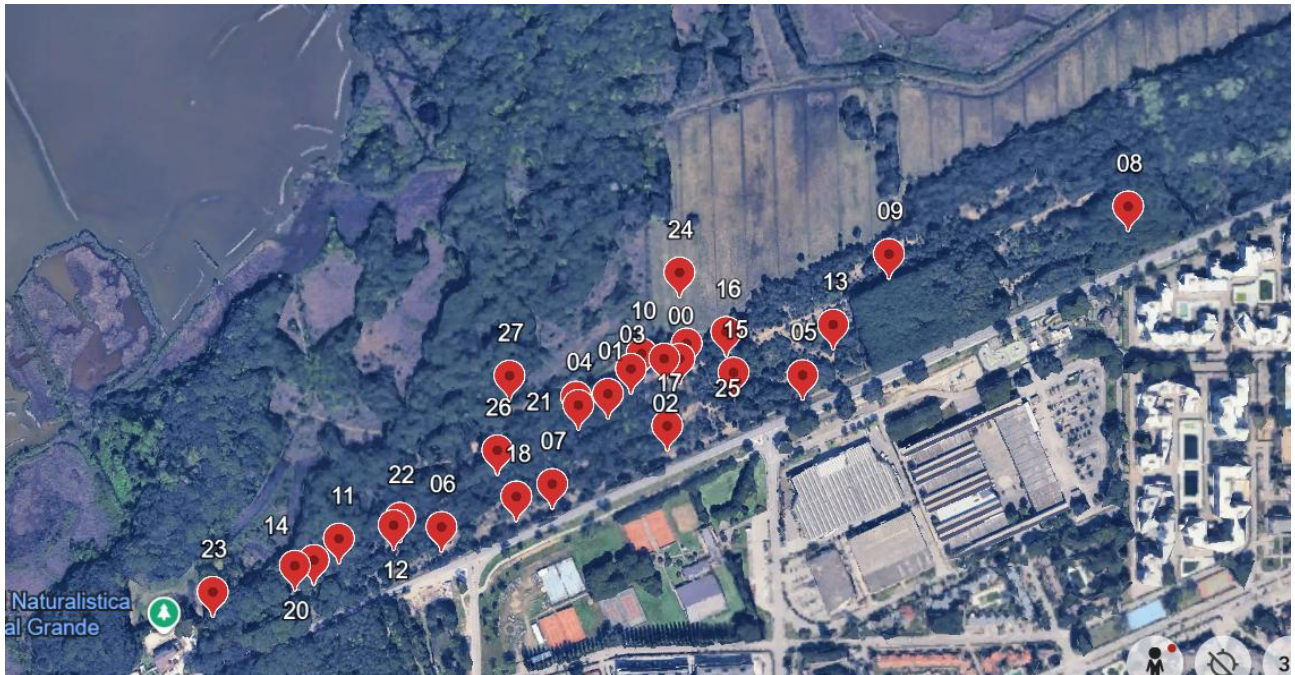
Figura 5 Distribuzione spaziale degli individui contattati nell'area di studio.

Di seguito l'immagine di Google Earth che mostra la distribuzione spaziale degli individui contattati nel sito di interesse.