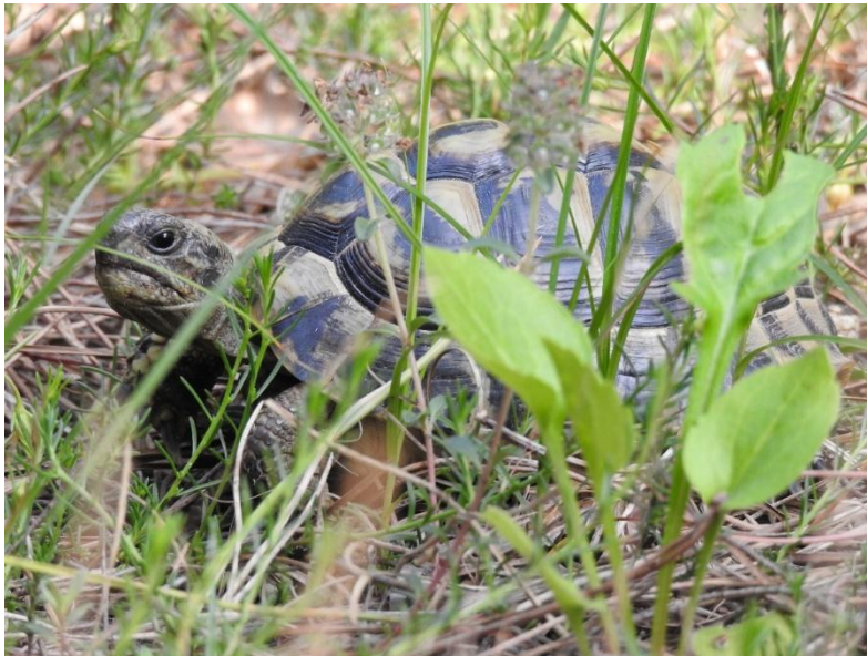
Figura 1 Individuo di Testudo hermanni nel suo habitat.