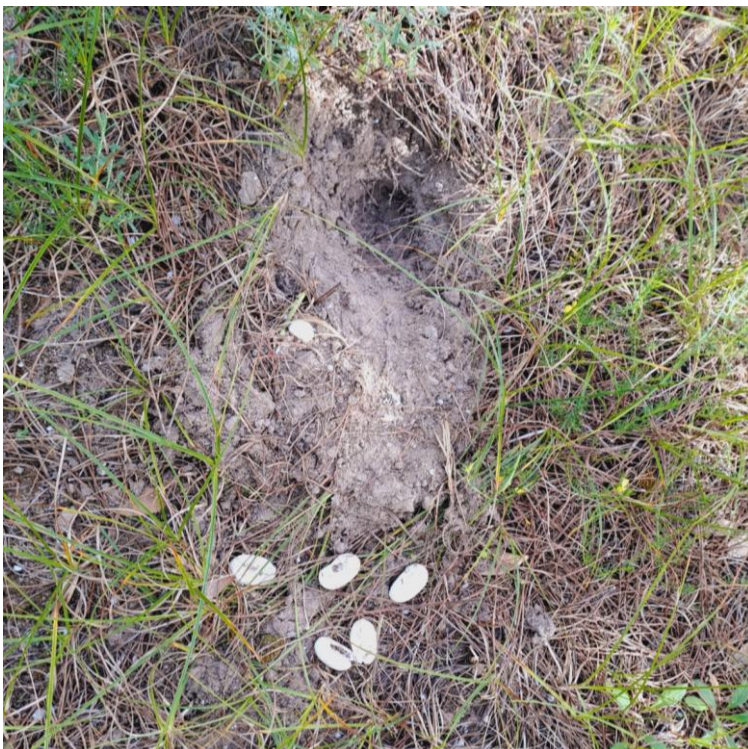
Figura 8 Nido schiuso di Testudo hermanni .